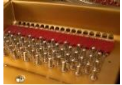
Fig.: A sound reflecting rim, a strictly limited soundboard and pressure bar bridges.