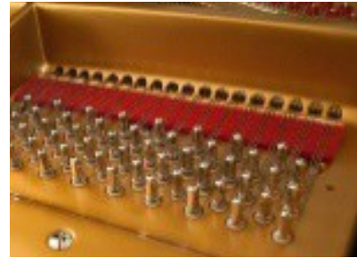
Fig.: A sound reflecting rim, a strictly limited soundboard and pressure bar bridges.