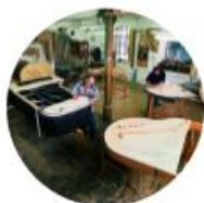
Fabbrica Steingraeber Bayreuth - Germania

Steingraeber & Söhne KLAVIERMANIFAKTUR IN BAYREUTH SEIT 1826