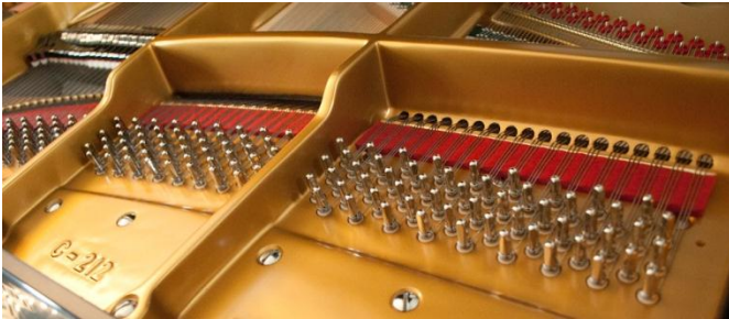
Fig.: Pressure bar bridges. Abb.: Klangbrücken am Kapodaster.